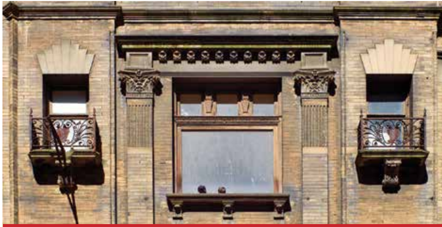
Extra care was given to cleaning and restoring the Dineen’s buff brick exterior and unique wrought-iron balconies.